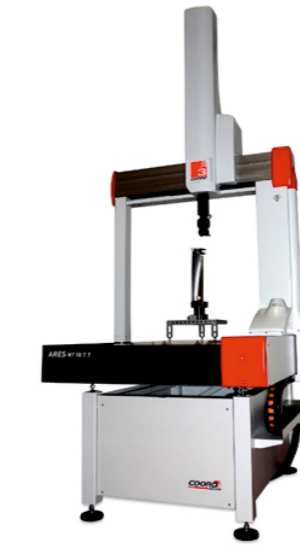
COORD 3D 1 Adet