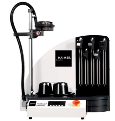
HAIMER Economic Plus NG 1 Adet