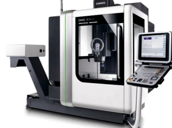
DMC 835 V 1 Adet