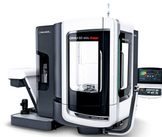
Highlights DMU 60 eVo / linear 1 Adet