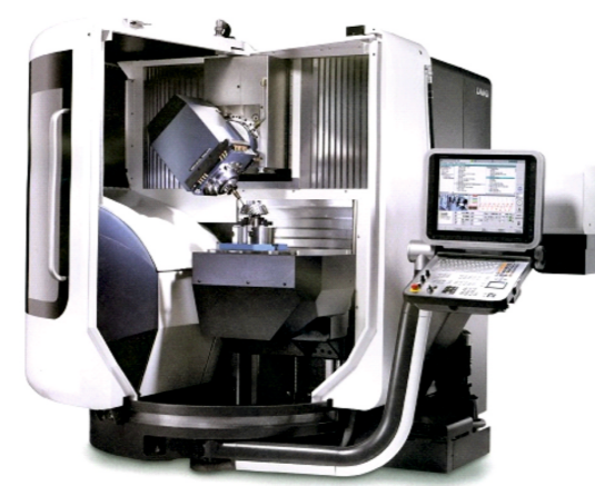
Highlights DMU 60 Monoblock 1 Adet