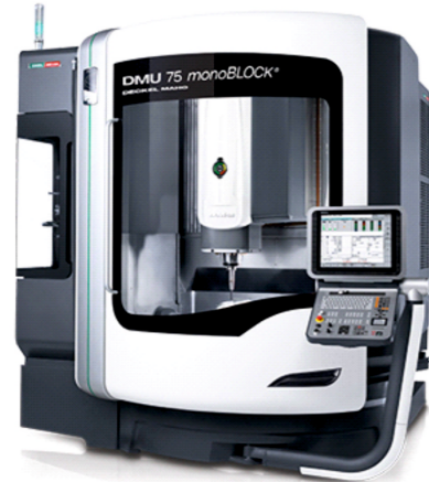
Highlights DMU 75 monoBLOCK® 1 Adet