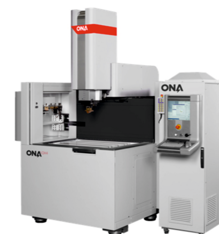
ONA QX4 CNC EDM 1 Adet