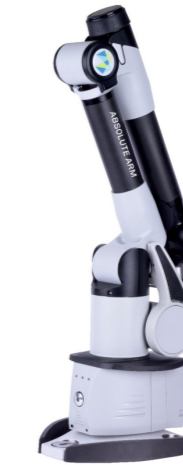
ABSOLUTE ARM HASSAS ÖLÇME 1 Adet